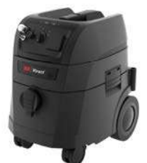
3M Xtract™ Mobile Absaugereinheit