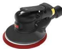
3M Xtract™ Exzentrerschleifer

Die neuen 3M Xtract™ Gitternetz Schleifscheiben bieten eine branchenführende Abtragsrate und tragen zu einer sauberen Arbeitsumgebung bei. Das ermöglicht eine bessere Leistung und bessere Schleifergebnisse. Auch verfügbar als Schleifstreifen im Rollenformat: 3M™ Cubitron™ II Gitternetz Schleifstreifen auf Rolle.