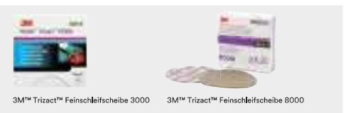
3M™ Trizact™ Feinschleifscheibe 3000