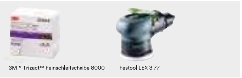
3M™ Trizact™ Feinschleifscheibe 8000