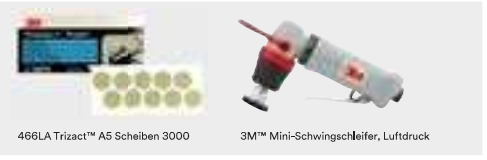
466LA Trizact™ A5 Scheiben 3000