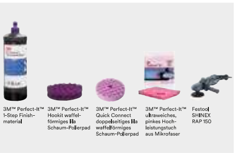
3M™ Perfect-It™ 1-Step Finish-Material