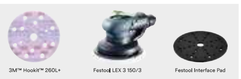
3M™ Hookit™ 260L+