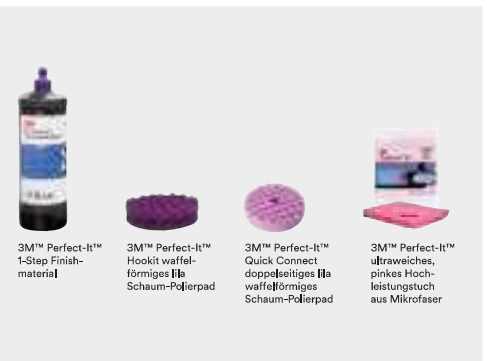
3M™ Perfect-It™ 1-Step Finish-Material