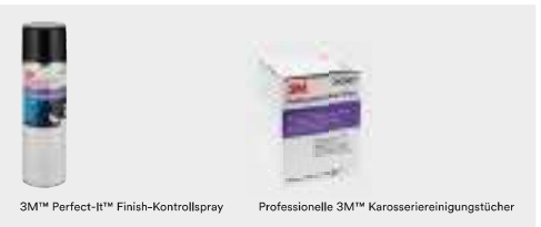
3M™ Perfect-It™ Finish-Kontrollspray