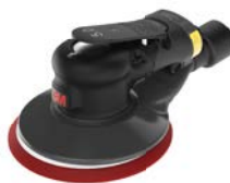
3M Xtract™ Exzentrerschleifer

Die neuen 3M Xtract™ Gitternetz Schleifscheiben bieten eine branchenführende Abtragsrate und tragen zu einer sauberen Arbeitsumgebung bei. Das ermöglicht eine bessere Leistung und bessere Schleifergebnisse. Auch verfügbar als Schleifstreifen im Rollenformat: 3M™ Cubitron™ II Gitternetz Schleifstreifen auf Rolle.